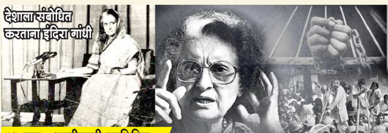
देशाला संबोधित करताना इंदिरा गांधी

रायबरेली लोकसभा मतदारसंघात इंदिरा गांधींनी समाजवादी नेते राजनारायण यांचा जवळपास एक लाखांहून अधिक मतांनी पराभव केला होता. मात्र राजनारायण विजयाबाबत एवढे आश्चर्य होते की त्यांनी