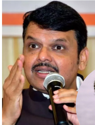
लगावला आहे. विधानसभा निवडणुकीत मतदानाच्या वाढीवर

तर हवेत तीर मारण्याची वेळ त्यांच्यावर आली नसती, असा टोला मुख्यमंत्री देवेंद्र फडणवीस यांनी