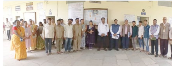
कोतोली : हॅलो प्रभात