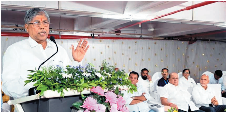
महाविद्यालय व रुग्णालय, मिरज येथे शस्त्रक्रियागृह फेज २, ग्रंथालय व डी. एस. ए. मशीन लोकार्पण, एसटीपी प्लँट कार्यांभ व वसतिगृह, आंतररुग्ण व बाह्यरुग्ण विभाग दुरुस्ती

पालकमंत्री चंद्रकांत पाटील सांगली : हॅलो प्रभात कोविड पासून सर्वजण वैद्यकीय सेवेच्या बाबतीत सतर्क झाले आहेत. आरोग्य सुविधा सक्षम करण्यासाठी व उत्तम सोयीसुविधा देण्यासाठी शासन कुठेही कमी पडणार नाही. सर्वसामान्य नागरिकांना दर्जेदार आरोग्य सेवा मिळण्यासाठी आवश्यक निधी उपलब्ध करून देऊ, असे प्रतिपादन राज्याचे उच्च व तंत्र शिक्षण, संसदीय कार्य मंत्री तथा सांगली जिल्ह्याचे पालकमंत्री चंद्रकांत पाटील यांनी केले.