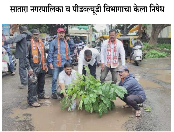
सातारा नगरपालिका व पीडब्ल्यूडी विभागाचा केला निषेध

गणेशोत्सवाच्या पार्श्वभूमीवर रस्त्यांची दुरुस्ती करणे गरजेचे आहे जे रस्ते टेकेदारांना कराराने दिलेले आहेत त्या टेकेदारांना दुरुस्ती करून घेणे ही नगरपालिकेची जबाबदारी आहे. सार्वजनिक बांधकाम विभाग या संदर्भात भूमिका घेताना दिसत नाही पावसाची तांत्रिक अडचण वगळली तरी यापूर्वीचे रस्ते दर्जेदार असते तर हा प्रकार उद्भवलाच नसता या संदर्भात पालिकेने योग्य वेळी भूमिका घेतली नाही तर शिवसैनिक याहीपेक्षा जास्त तीव्र स्वरूपाचे आंदोलन करतील असा इशारा त्यांनी दिला.