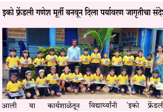
इको फ्रेंडली गणेश मूर्ती बनवून दिला पर्यावरण जागृतीचा संदेश

विटा : हॅलो प्रभात लगतच्या काळात गणेशोत्सवाची सर्वजण आतुरतेने वाट पाहू लागले आहेत. काही ठिकाणी तर गणेशोत्सवाची तयारी अंतिम टप्प्यात आली आहे. आपल्या लाडक्या गणाराच्या आगमनाची आतुरता सर्वांनाच लागली आहे. जिकडेतिकडे गणाराच्या मूर्ती बनवण्याचे काम सुरू आहे.विविध रंगांनी गणाराच्या मूर्ती सुशोभित करण्याचे काम कारागीर करत असल्याचे चित्र दिसत आहे. या गणेशोत्सवासाठी भारतमाता ज्ञानपीठ संचलित सौ.विजयमाला पतंगराव कदम प्राथमिक,माध्यमिक,व उच्च माध्यमिक विद्यालय विटा येथे गणेश मूर्ती बनवण्याची कार्यशाळा घेण्यात आली या कार्यशाळेतून विद्यार्थ्यांनी 'इको फ्रेंडली'