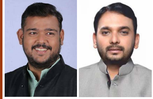
सांगली : विशेष प्रतिनिधी