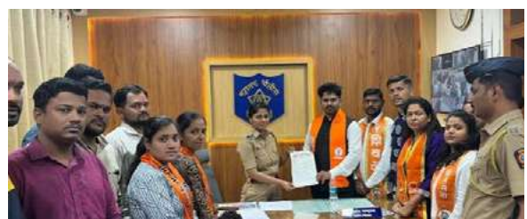
कॉलेजबाहेर सुटण्याच्या वेळी महिला पोलीस नेमून पथके एक्टिव्ह करून कारवाई करावी, अन्यथा विद्यार्थ्यांच्या सुरक्षेसाठी युवासेना रस्त्यावर