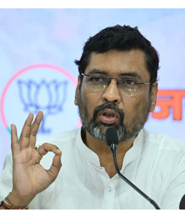
मंडल आयोगाच्या अंमलबजावणीला काँग्रेसचे त्यावेळेचे अध्यक्ष राजीव गांधी यांनी ६ सप्टेंबर १९९० रोजी