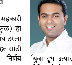
'युवा दूध उत्पादक वर्ष' म्हणून घोषित केले असून, युवकांना दुग्धव्यवसायाकडे आकर्षित करण्याचा संकल्प करण्यात आला आहे. करमाळा येथील सौर प्रकल्पामुळे दरवर्षी ७-८ कोटींची बचत होणार असून, आर्थिक स्थैर्य अधिक बळकट

गाय-म्हैस दूध दरात प्रति लिटर १ रुपया वाढ, जातिवंत म्हैस खरेदी अनुदान ५० हजार रुपये, इमारत अनुदान वाढ, वासरू संगोपन योजनेत वाढ, तसेच मिनरल मिक्सचर ५०%