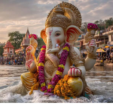
सांगली : विशेष प्रतिनिधी

गणपती बाप्पांकडून पुढच्या वर्षी येण्याचं आश्वासन घेऊन बाप्पांना जल्लोषात निरोप देण्यात आला. यंदा गणेशोत्सव सोहळा आणि दिवाळी निवडणुकांच्या आधी आल्या आहेत. त्यामुळेच राजकारणाच्या रिणात उतरण्याची तयारी केलेल्या महारथींच्या पळवाटा बंद झाल्या होत्या.