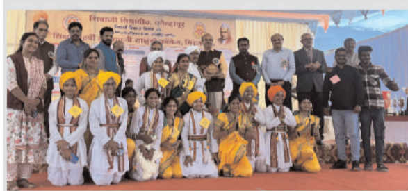
द्वितीय क्रमांकाची कामगिरी