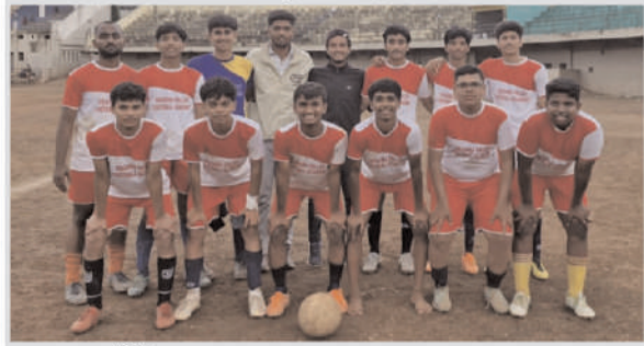
कुपवाड : हॅलो प्रभात

सातारा जिल्हा क्रीडा अधिकारी कार्यालयामार्फत दि.१६ सप्टेंबर २०२५ रोजी सातारा येथील शिवाजी स्टेडियमवर विभागीय स्तरीय १९ वर्षाखालील शालेय फुटबॉल स्पर्धेचे आयोजन करण्यात आले होते.