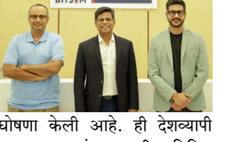
बिटसॉमने मसाईसोबत सहयोगाने ऑल इंडिया बिटसॉम टेस्ट फॉर ऑनलाइन प्रोग्राम्स (टॉप-२०२५) च्या लॉचची घोषणा केली आहे.

मुंबई : हॅलो प्रभात बिटसॉमने मसाईसोबत सहयोगाने ऑल इंडिया बिटसॉम टेस्ट फॉर ऑनलाइन प्रोग्राम्स (टॉप-२०२५) च्या लॉचची घोषणा केली आहे. ही देशव्यापी ऑनलाइन परीक्षा विद्यार्थ्यांना व्यवसाय व तंत्रज्ञानामधील विविध व्यावसायिक प्रोग्राम्सकरिता पात्र ठरण्यास आणि त्यामधून निवड करण्यास सक्षम करण्यासाठी डिझाइन करण्यात आली आहे. १२ ऑक्टोबर रोजी घेण्यात येणारी ही परीक्षा गुण-आधारित कोर्स निवड मॉडेलला सादर करेल, जो विद्यार्थ्यांना विभागातील कामगिरीवर आधारित त्यांचा पसंतीचा प्रोग्राम निवडण्याची सुविधा देतो. या उपक्रमाचा एकमेव मूल्यांकन प्रवेश आणि वैविध्यपूर्ण अध्ययन मार्गांना एकत्र करत व्यवस्थापन व तंत्रज्ञान शिक्षणाला अधिक सहजसाध्य आणि स्थिर करण्याचा समसुबा आहो.