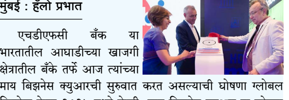
एचडीएफसी बँक या भारतातील आघाडीच्या खाजगी क्षेत्रातील बँके तर्फे आज त्यांच्या माय बिझनेस क्युआरची सुरुवात करत असल्याची घोषणा ग्लोबल फिनटेक फेस्ट २०२५ मध्ये केली.

मुंबई : हॅलो प्रभात एचडीएफसी बँक या भारतातील आघाडीच्या खाजगी क्षेत्रातील बँके तर्फे आज त्यांच्या माय बिझनेस क्युआरची सुरुवात करत असल्याची घोषणा ग्लोबल फिनटेक फेस्ट २०२५ मध्ये केली. माय बिझनेस क्युआर हा छोट्या व्यावसायिकांसाठी विशेष असा भारतातील पहिला कॉमर्स आयडेंटिटी क्युआर आहे. या क्युआरची सुरुवात ही बँकेच्या स्मार्ट हब व्यापार या प्रसिद्ध अॅपची पुढची पायरी म्हणून व्यापारीफाय च्या सहकार्याने करण्यात आली असून स्मार्टहब व्यापारचे आधी पासूनच देशभरातील २ दशलक्षांहून अधिक व्यापारी वापर करत आहेत.