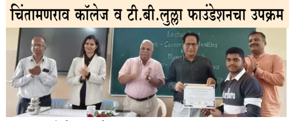
चिंतामणराव कॉलेज व टी.बी.लुल्ला फाउंडेशनचा उपक्रम

सांगली : हॅलो प्रभात चिंतामणराव कॉलेज ऑफ कॉमर्स आणि टी. बी. लुल्ला चॅरिटेबल फाउंडेशन यांच्या संयुक्त विद्यमाने आयोजित 'How to be Industry Ready?' या विषयावरील १२ दिवसीय लेक्चर सिरीजचा समारोप उत्साहात झाला. १५ ते ३० सप्टेंबर २०२५ दरम्यान झालेल्या या सिरीजला विद्यार्थ्यांकडून प्रचंड प्रतिसाद लाभला. या मालिकेत उद्योगजगत, शिक्षण आणि व्यवस्थापन क्षेत्रातील नामांकित व्याख्याते सहभागी झाले. या सिरीजच्या माध्यमातून विद्यार्थ्यांना सॉफ्ट स्किल्स, करिअर संधी, प्रॅक्टिकल