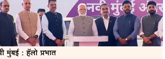
भारताचे पंतप्रधान नरेंद्र मोदी यांनी नवी मुंबई आंतरराष्ट्रीय विमानतळाचे उद्घाटन केले.

नवी मुंबई : हॅलो प्रभात भारताचे पंतप्रधान नरेंद्र मोदी यांनी नवी मुंबई आंतरराष्ट्रीय विमानतळाचे उद्घाटन केले. हा देशातील सर्वात महत्वाकांक्षी पायाभूत प्रकल्पांपैकी एक असून भारताच्या विमान वाहतूक क्षेत्रातील एक निर्णायक टप्पा ठरला आहे. या प्रसंगी पंतप्रधान म्हणाले, 'मुंबईचा अनेक वर्षांचा प्रतिकेचा क्षण आज पूर्ण झाला आहे. आता मुंबईला तिचा दुसरा आंतरराष्ट्रीय विमानतळ मिळाला आहे. नवी मुंबई आंतरराष्ट्रीय विमानतळ संपूर्ण या परिसराला आशियातील सर्वात मोठा कनेक्टिव्हिटी हब बनवण्यात महत्त्वाची भूमिका बजावेल.'