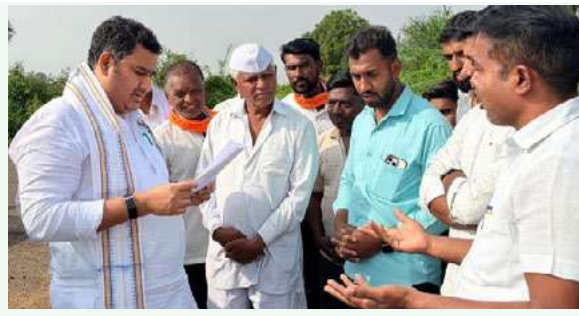
कार्यकर्त्यांच्या दबावाखाली युक्तगणार नाहीत. ग्रामस्थांनी स्पष्ट केले आहे की ते कोणत्याही पक्षविरोधी नाहीत परंतु गावाच्या विकासाला अडथळा निर्माण करणाऱ्या राजकीय गोंधळाला

देणार नाही. या विधानामुळे सामान्य नागरिकांमध्ये असंतोष व नाराजीचे वातावरण निर्माण झाले आहे. ग्रामस्थांनी आपल्या निवेदनात नमूद केले आहे की विकासकामे, शासकीय योजना आणि जनतेचे मूलभूत हक्क यांना कोणत्याही राजकीय दबावाशी जोडणे हा लोकशाहीचा अवमान असून, शासनाच्या मूल्यांचा अपमान आहे. ग्रामस्थ विकाससाठी काळे यांच्या