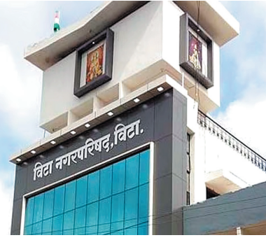
व राष्ट्रवादी अशी तिरंगी लढत होणार आहे.