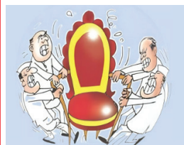
■ उमेदवारी जाहीर होण्यापूर्वीच एबी फॉर्म वाटप

पुणे महापालिका निवडणुकीसाठी इच्छुकांची मोठी संख्या लक्षात घेता भाजपमध्ये बंडखोरी होऊ नये, यासाठी उमेदवारी यादी जाहीर न करता थेट उमेदवार निश्चित करून एबी फॉर्म देण्याची रणनीती पक्षाने अवलंबल्याचे समोर आले आहे. मात्र, तरीही भाजपमध्ये संभाव्य बंडखोरीची शक्यता कायम असून, त्याची झळक सोमवारी पाहायला मिळाली. केंद्र व राज्यात सत्तेत असलेल्या भाजपकडून महापालिका निवडणुकीसाठी मोठ्या प्रमाणावर इच्छुक आहेत. १२० हून अधिक जागा जिंकण्याचे लक्ष्य ठेवत ज्या प्रभागांमध्ये भाजपची ताकद कमी आहे, त्या ठिकाणी इतर पक्षांतील प्रभावी नेते व इच्छुकांना पक्षात प्रवेश देण्यात आला आहे. यात राष्ट्रवादी काँग्रेस (अजित पवार गट), राष्ट्रवादी काँग्रेस (शरद पवार गट) तसेच काँग्रेसमधील काही नेत्यांचा समावेश आहे. यामुळे स्थानिक आमदार व कार्यकर्त्यांमध्ये नाराजीचे वातावरण निर्माण झाले होते. या पार्श्वभूमीवर भाजपच्या कोअर कमिटीच्या बैठकीत स्थानिक आमदारांचा विश्वास घेऊन उमेदवारांची नावे निश्चित करण्यात आली. ही यादी प्रदेश कार्यालयाकडे पाठवण्यात