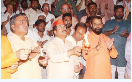
सांगली : हॅलो प्रभात

रामनवमीच्या निमित्ताने कृष्णाकाठ आणि माई घाट येथे ५१ फूटी प्रभू श्रीरामाच्या प्रतिमेसमोर ११ हजार १११ दिव्यांचा भव्य दिपोत्सव आयोजित करण्यात आला. पृथ्वीराज पाटील फाऊंडेशनच्या वतीने संस्कार भारती आणि ज्ञानमंथन संस्थांच्या सहकार्याने आयोजित या सोहळ्यात भक्तीगीत, महाआरती, आतिषबाजी आणि कलाकारांची रंगलेली मैफल झाल्याने सांगलीकरांनी 'जय श्रीराम' अशा जयजयकारात रामभक्तीचा अनुभव घेतला.