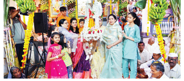
आष्टा : हॅलो प्रभात