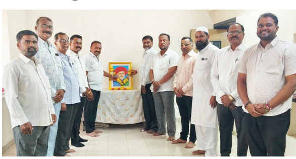
सांगली : हॅलो प्रभात

क्रांतिसूर्य महात्मा ज्योतिराव फुले यांच्या जयंतीनिमित्त राष्ट्रवादी काँग्रेस पार्टी (शरदचंद्र पवार) पक्षाच्या वतीने सांगली जिल्हा कार्यालयात अभिवादन करण्यात आले. यावेळी महात्मा फुले यांच्या प्रतिमेला पुष्पहार अर्पण करून त्यांच्या कार्याला विभ्रम अभिवादन करण्यात आले.