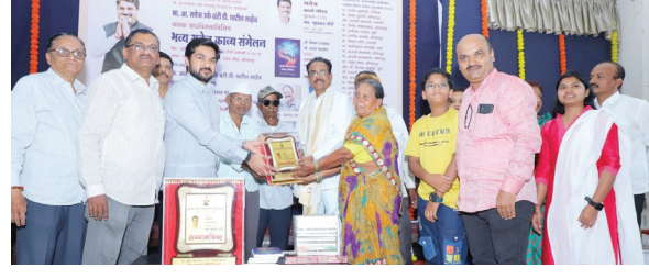
कोल्हापूर : हॅलो प्रभात