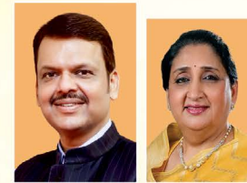
मा. ना. देवेंद्रजी फडणवीस मुख्यमंत्री, महाराष्ट्र राज्य